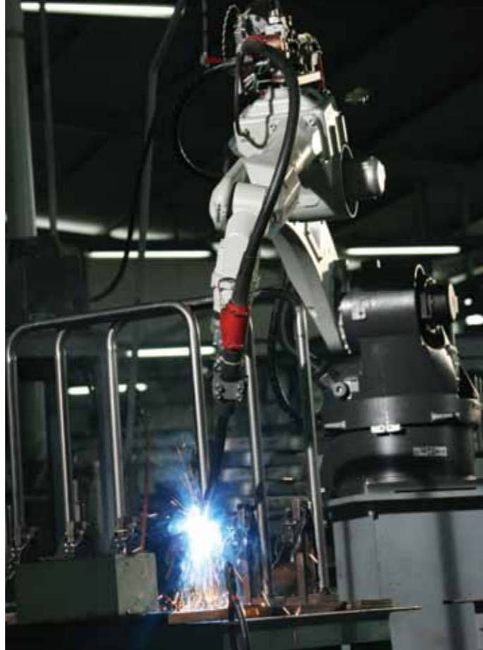
Top Left: Assembly line for nursing bed products