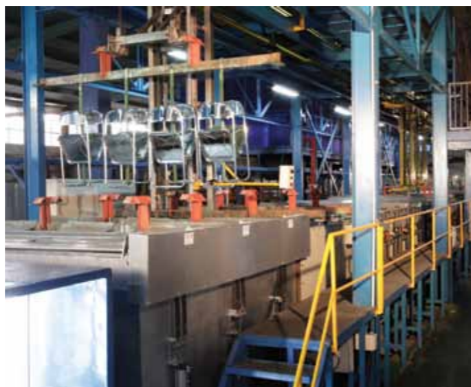
Bawah Kanan: Lini chrome plating