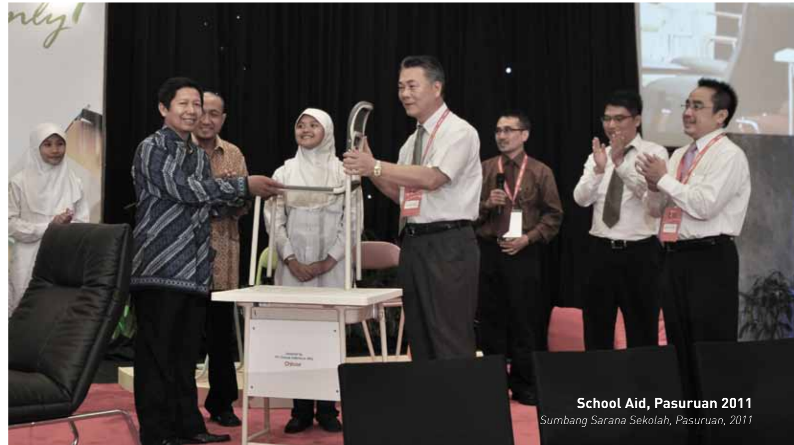
School Aid, Pasuruan 2011 Sumbang Sarana Sekolah, Pasuruan, 2011