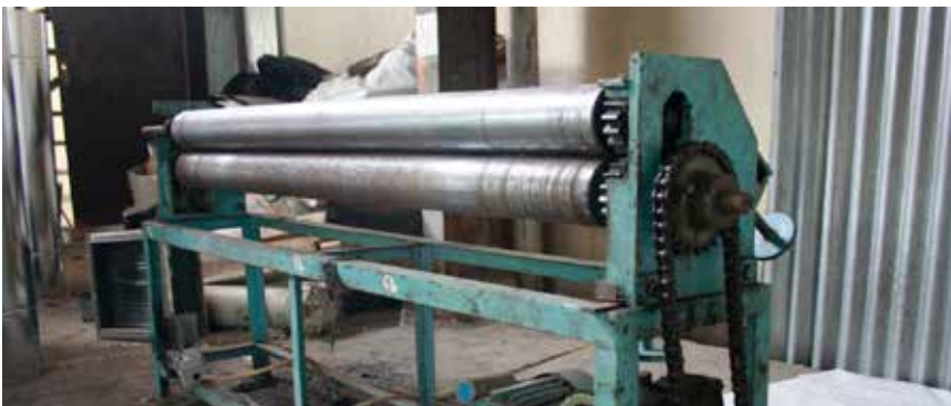
Roller Plate Bender