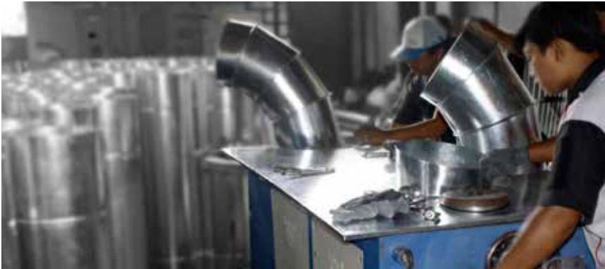
Elbow Making Machine