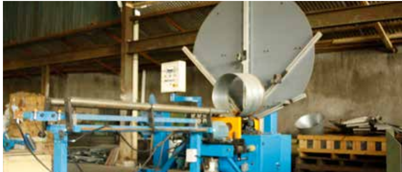
Steel-Band Type Spiral Ducting