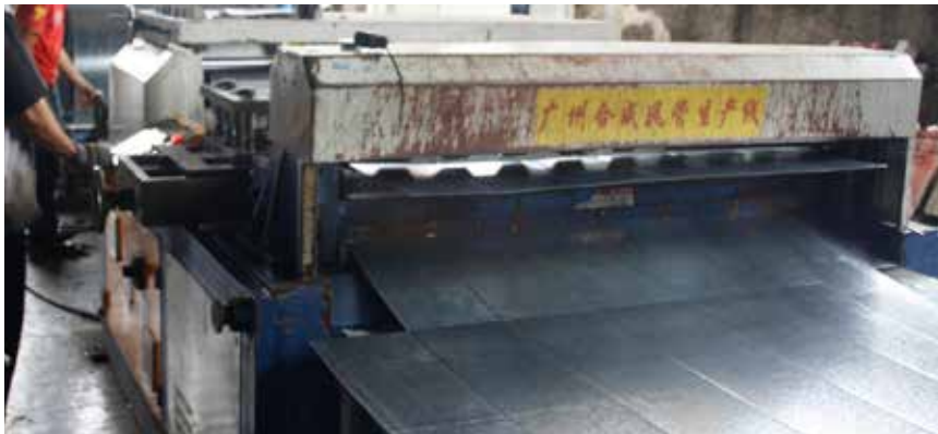
Duct Manufacturing Auto Line