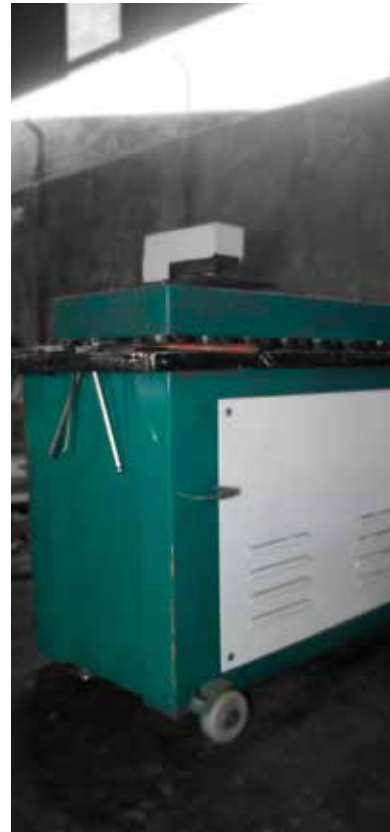
Lock Forming Machine