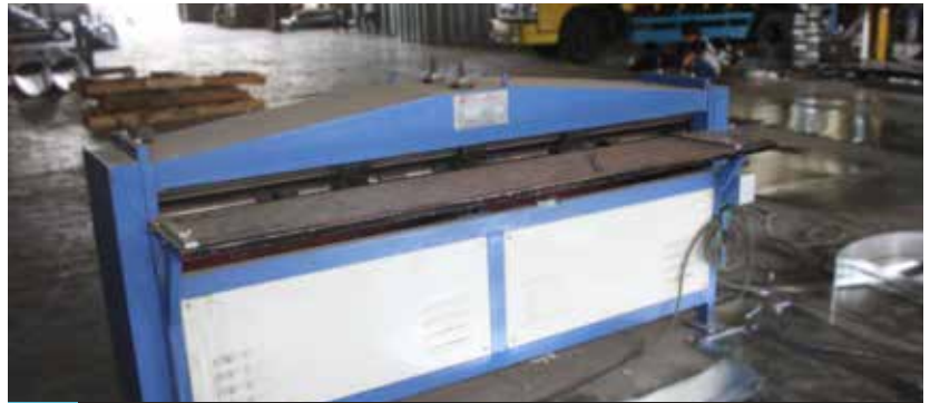
Quintuple Groove Beading Machine