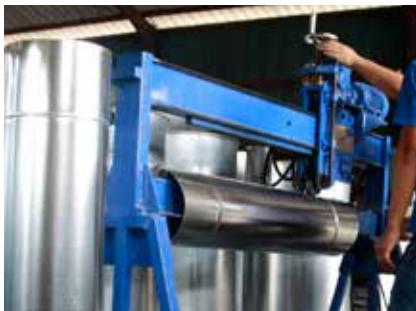
Vertical Groove Beading Machine