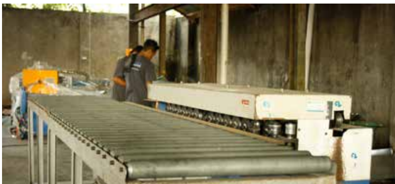
Vertical Groove Beading Machine