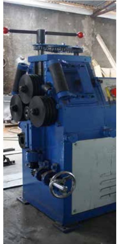
Angle Iron Bender