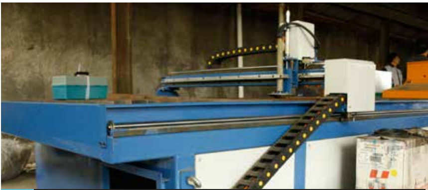
HDC Plasma Cutting Machine