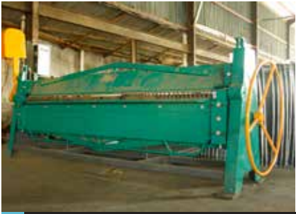
Flange Folding Machine