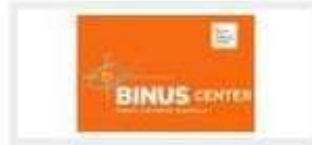
BINUS CENTER BINTARO, BANDUNG