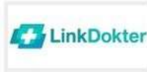
MEDIA DOKTER INVESTAMA