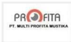
PT. MULTI PROFITA MUSTIKA