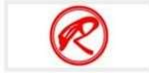
SAMUDRA RAYA, CV