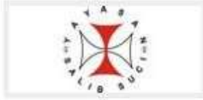
YAYASAN SALIB SUCI