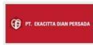
PT. EKACITTA DIAN PERSADA