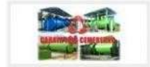
PT. CAHAYA MAS CEMERLANG, JAKARTA