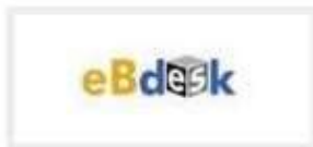
PT. EBDESK INDONESIA