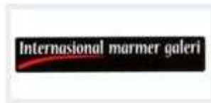
ADP (ADI DAYA PRIMA - INTERNASIONAL MARMER GALERI)