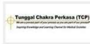
TUNG GAL CHAKRA PERKASA