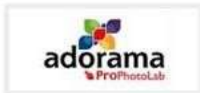
ADORAMA GROUP, JAKARTA