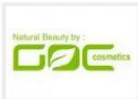
PT. GLORIA ORIGITA COSMETICS