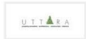
PT. UTTARA BANGUN PERSADA, JAKARTA