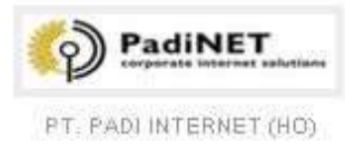
PT. PADI INTERNET (HO)