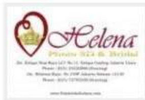
HELENA PHOTO BRIDAL