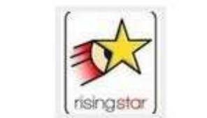
RISING STAR EDUCATION CENTER